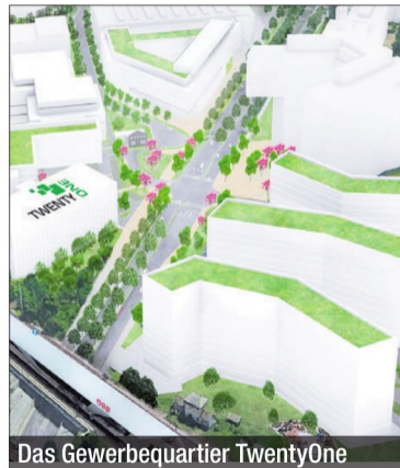
Das Gewerbequartier TwentyOne